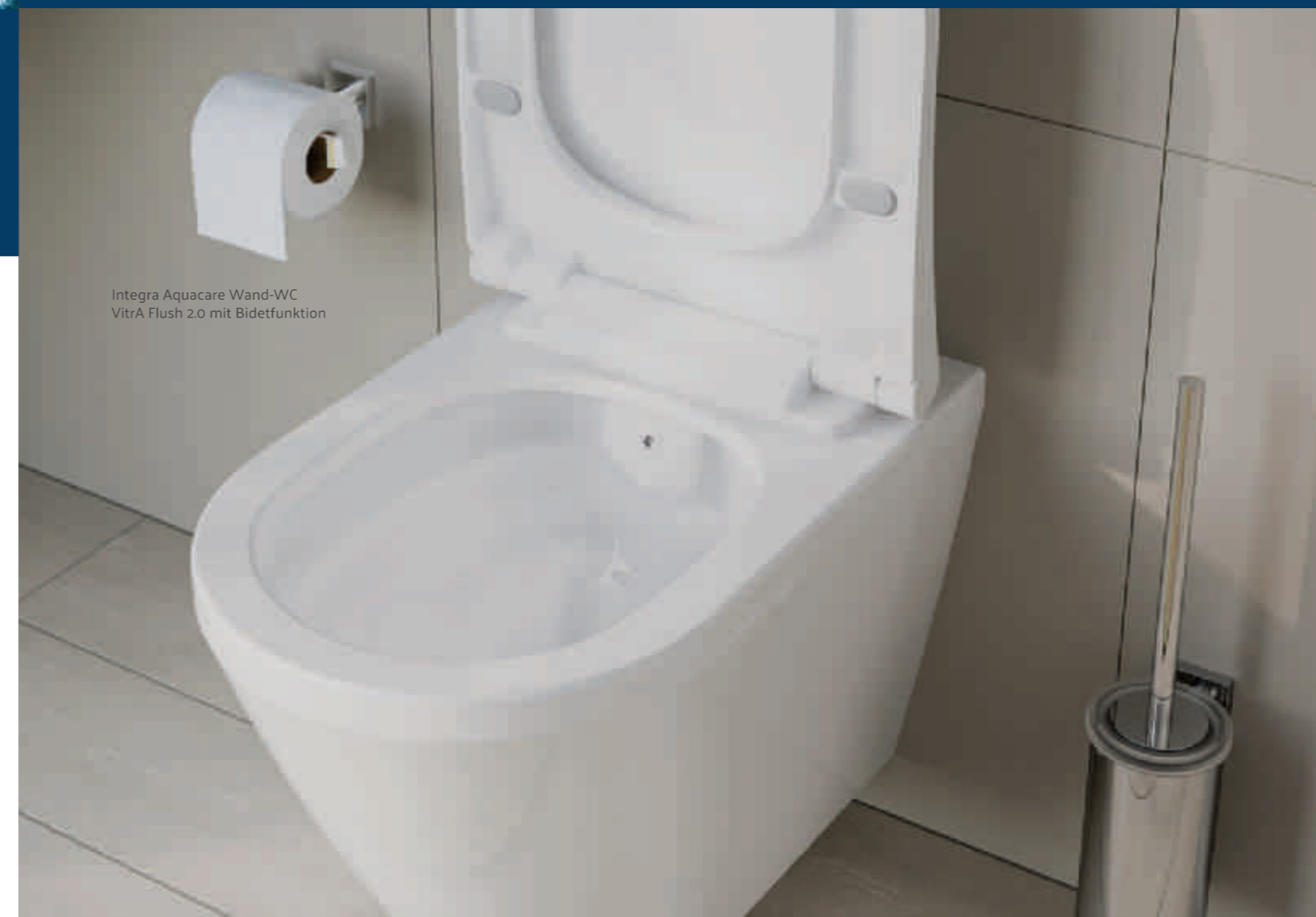
Integra Aquacare Wand-WC Vitra Flush 2.0 mit Bidetfunktion